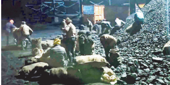
खदान से कोयला चोरी करते ग्रामीण।

इन दिनों गायत्री खदान से कोयला चोरी होने का सिलसिला थमने का नाम नहीं ले रहा। दिनदहाड़े कोयला चोरी ने प्रबंधन को नक में दम कर दिया है बल्कि सरकारी राजस्व को भी नुकसान पहुंच रहा है। हैरानी की बात तो यह है कि सुरक्षा के लिए जवानों की तैनाती के बावजूद चोरी का सिलसिला रुकने का नाम नहीं ले रहा है। सूरजपुर-सरगुजा सीमावर्ती क्षेत्र में कोयला चोरी का पूरा नेटवर्क बेहद संगठित तरीके से काम कर रहा है। खदान के अलग-अलग हिस्सों में मोटरसाइकिल और मिनी वाहनों के जरिए कोयला निकाल आसपास क्षेत्रों में खपा रहे हैं। ठंड बढ़ते ही एक बार फिर गायत्री खदान में